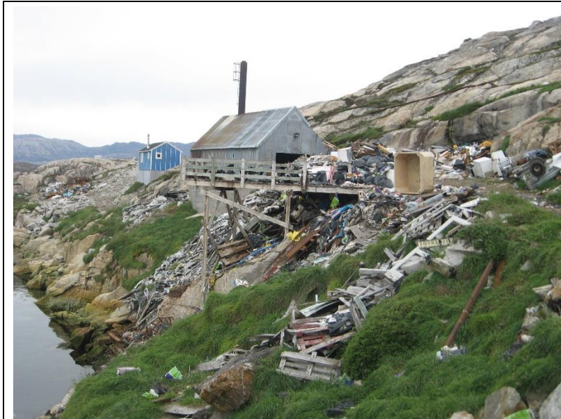
Område 1 Natrenovationsrampe.

Natrenovation på fjeldskrænt skaber lugt og andre problemer.