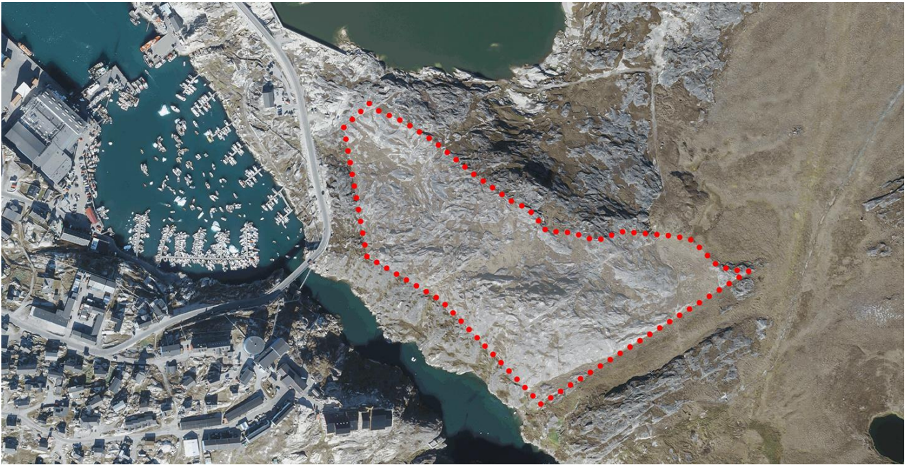
Immikkoortortami nutaami pissutsit pioreersut killeqarfíllu | Eksisterende forhold og afgrænsning af delområde A32.