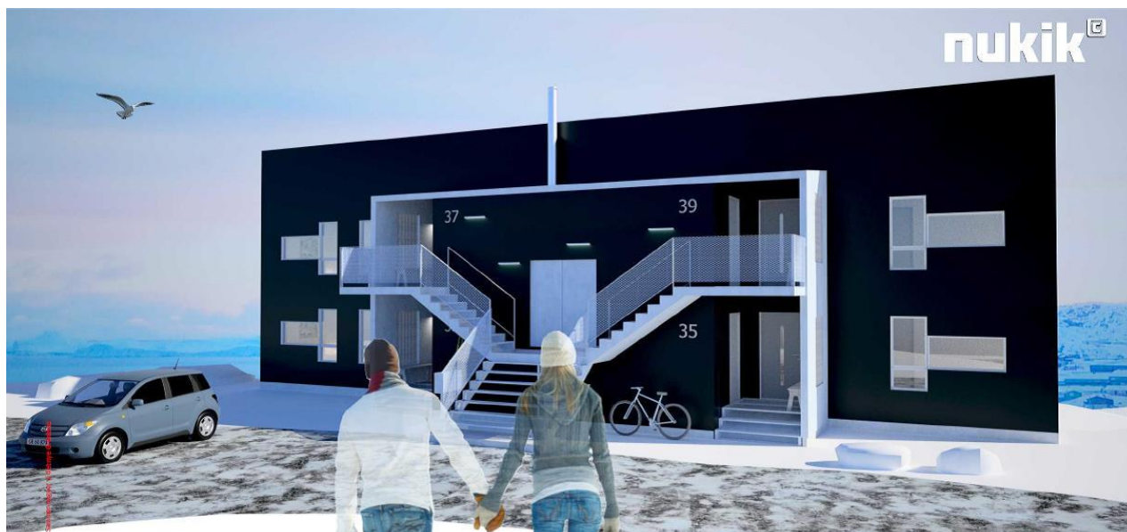
Sumiiffik A32-mi sanaartukkat nutaat takutinneqarnerat (sanaartorfik 3-10), kimmut sammiviall Illustration af ny bebyggelse i delområde A32 (byggefelt 3-10), vest facade.