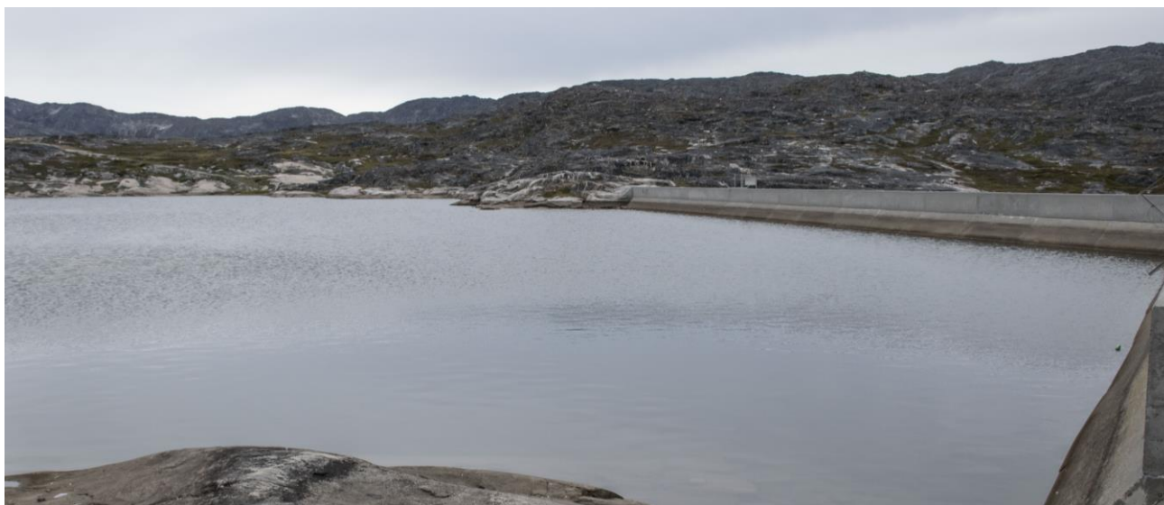
Imersuarmit kujammut sumiiffik A32-mut isikkivial | Kig mod delområde A32 syd over drikkevandssøen.