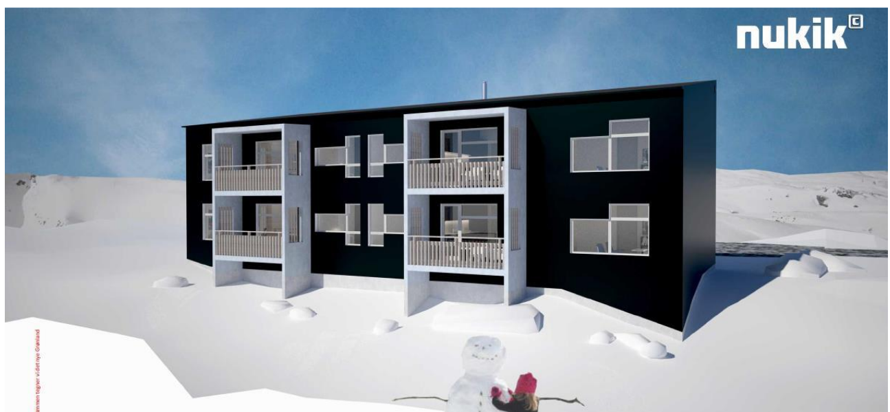
Sumiiffik A32-mi sanaartukkat nutaat takutinneqarnerat (sanaartorfik 3-10), kimmut sammivia | Illustration af ny bebyggelse i delområde A32 (byggefelt 3-10), vest facade.