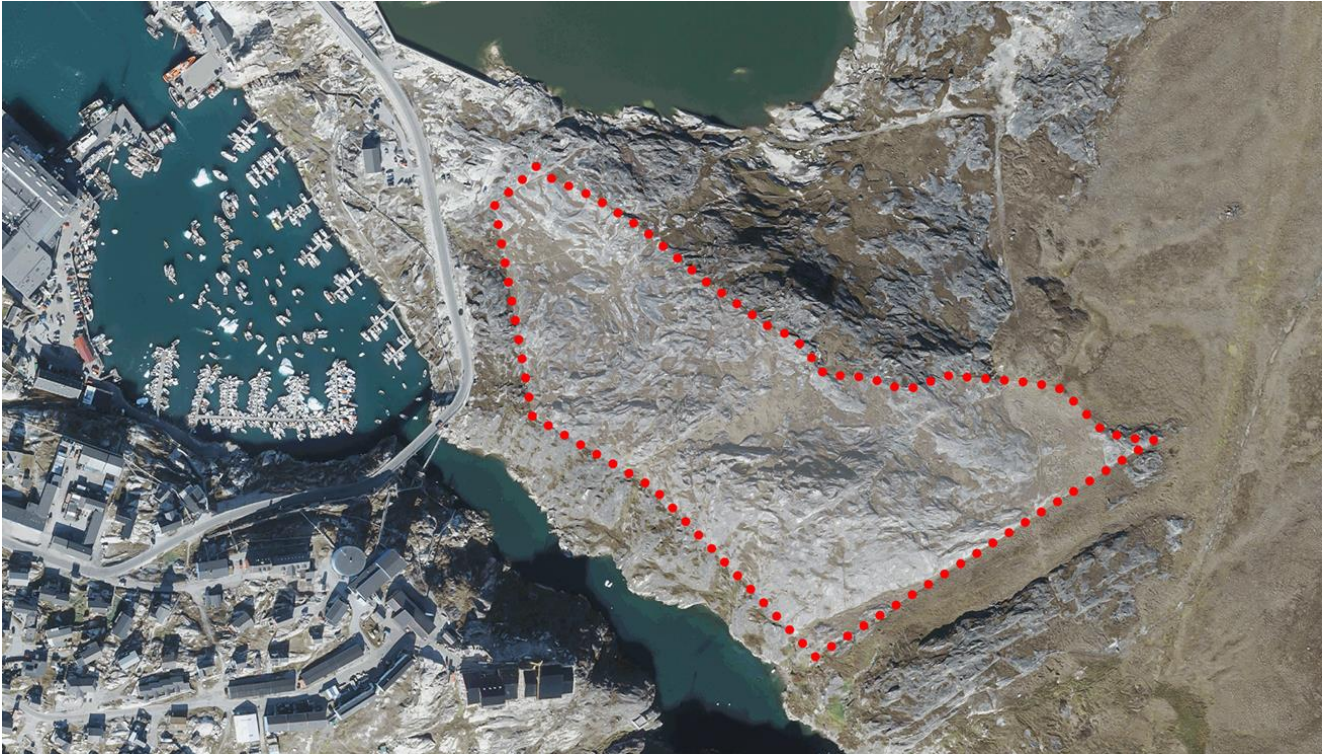
Immikkoortortami nutaami pissutsit pioreersut killeqarfiillu | Eksisterende forhold og afgrænsning af delområde.