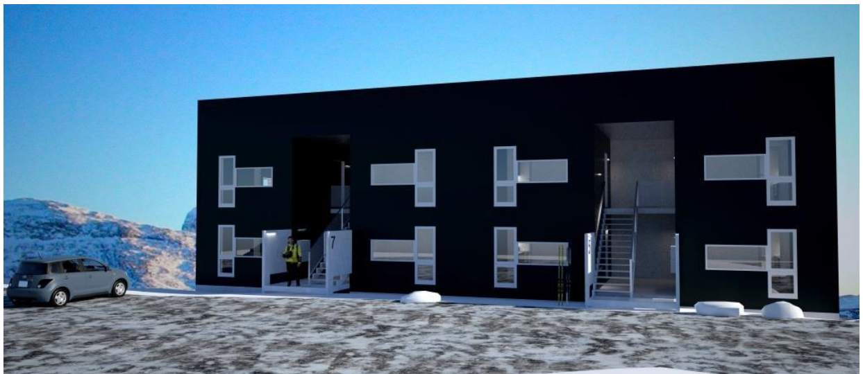
Sumiiffik A32-mi sanaartukkat nutaat takutinneqarnerat (sanaartorfik 1-2), kangimut sammivia | Illustration af ny bebyggelse i delområde A32 (byggefelt 1-2), øst facade.