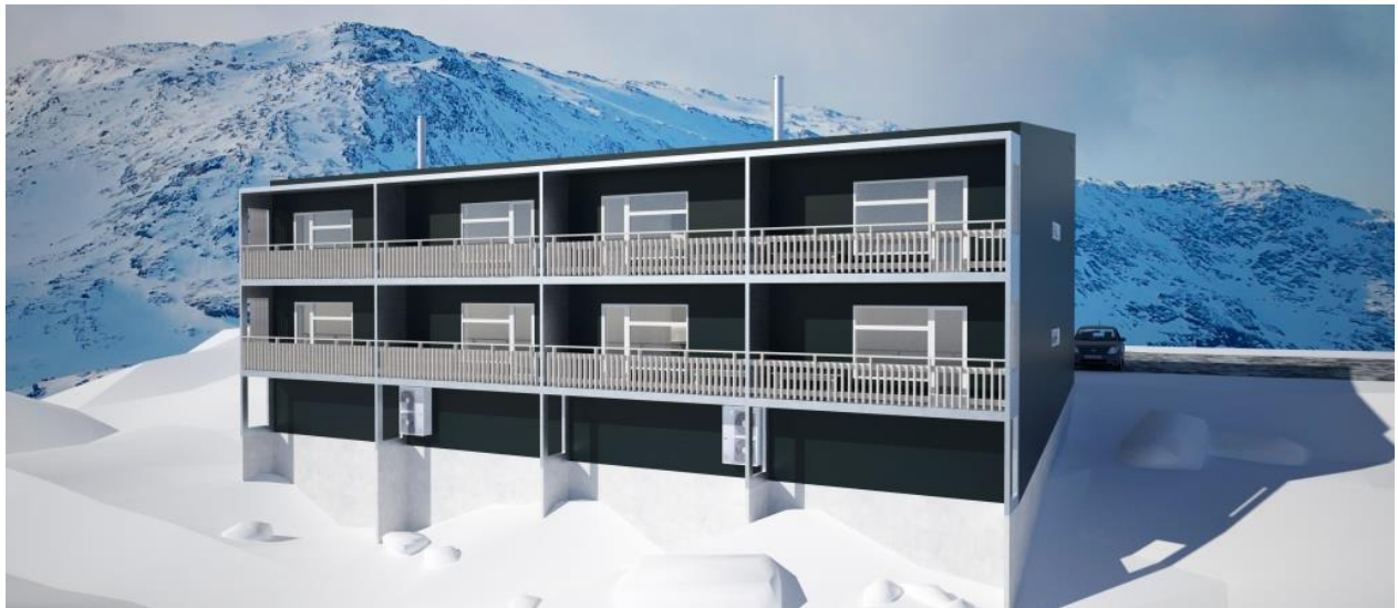
Sumiiffik A32-mi sanaartukkat nutaat takutinneqarnerat (sanaartorfik 1-2), kimmut sammivia | Illustration af ny bebyggelse i delområde A32 (byggefelt 1-2), vest facade.