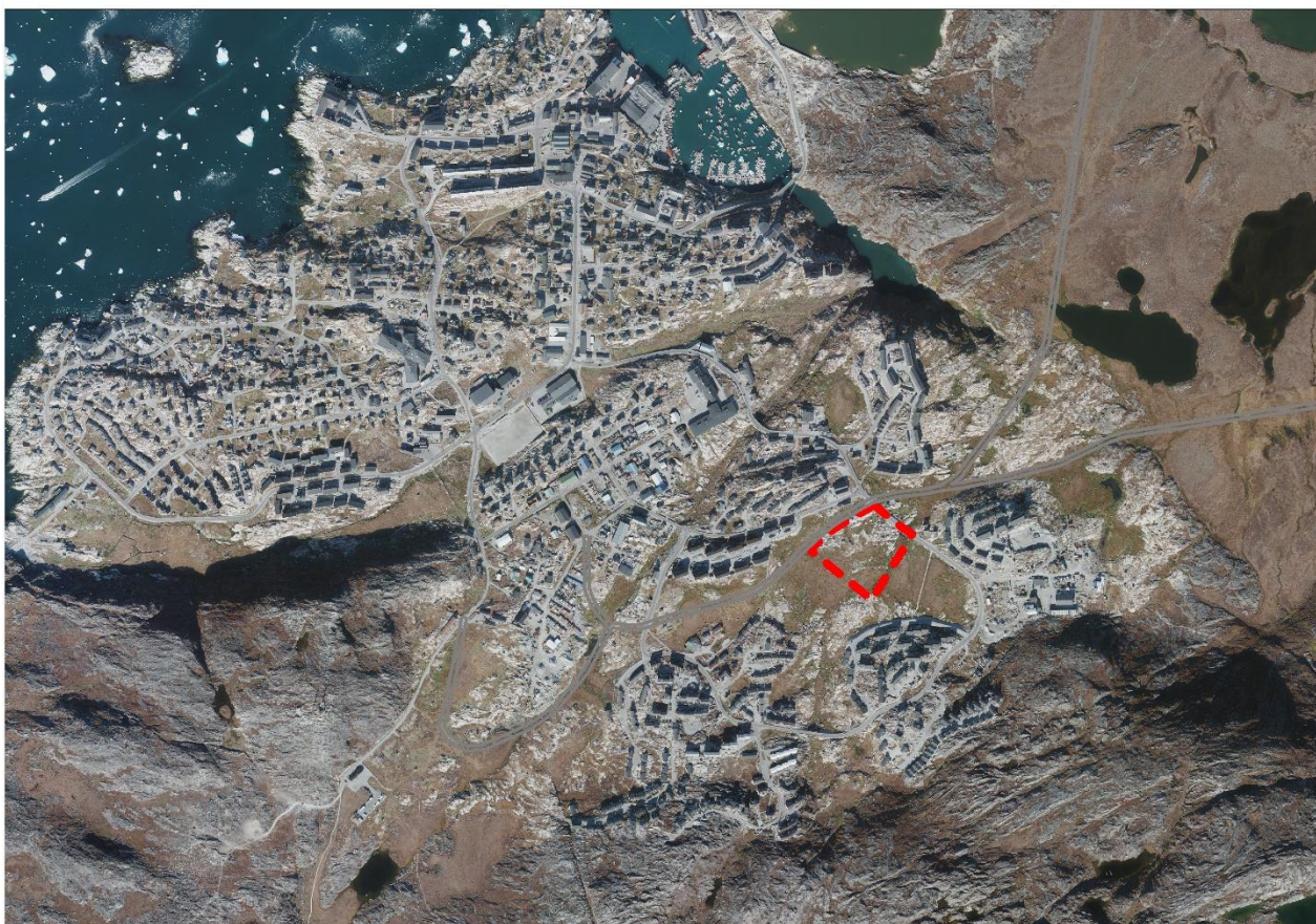
Ivigaasanik arsaattarfissap nutaap inissiffia | Placering af ny boldbane med kunstgræs.