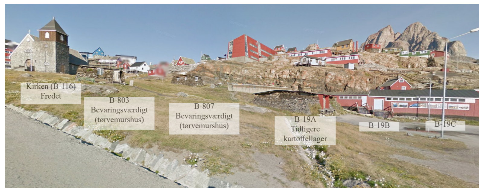
Set mod nordvest