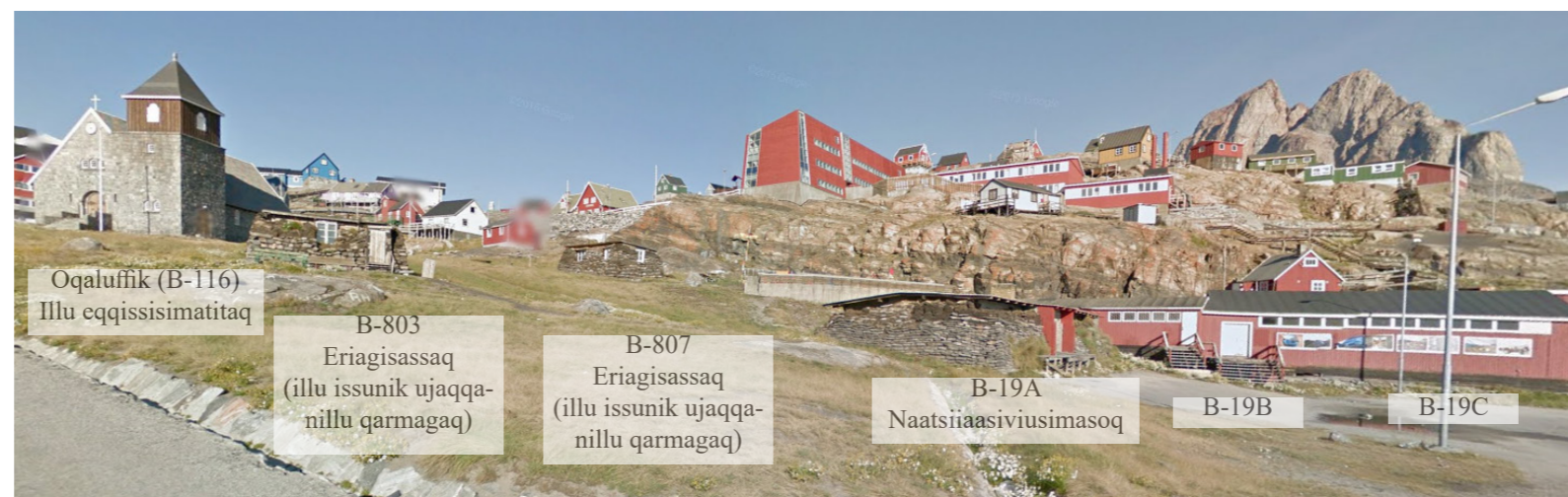
Avannamut kimmut isikkivía