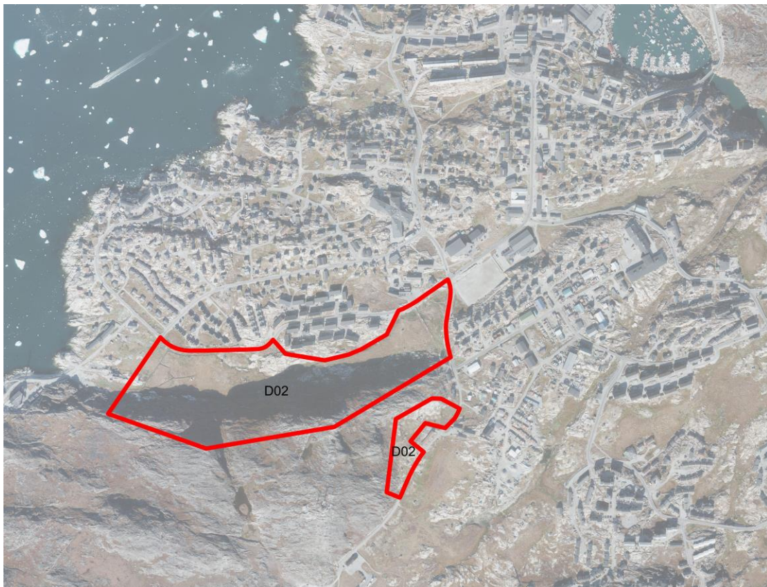
Immikk. D02-ip killilerneqarnera | Afgrænsning af delområde D02