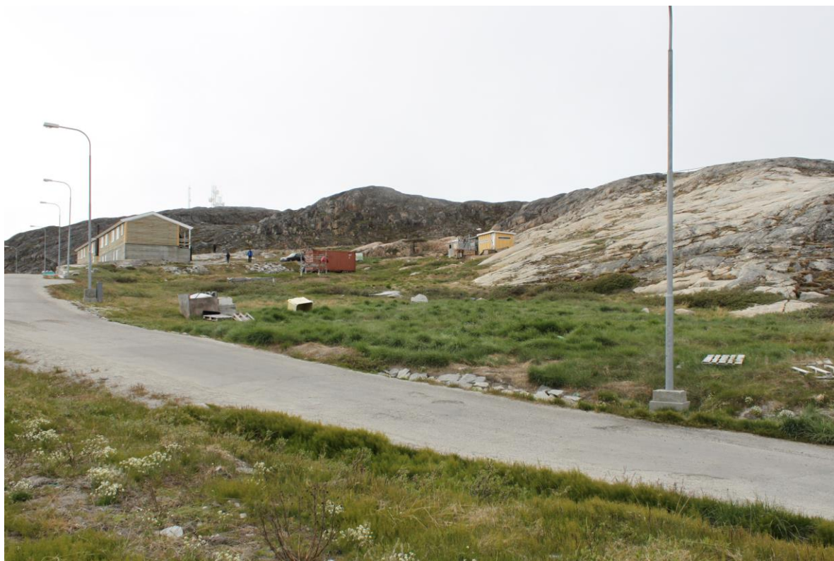
Sermermiut aqutaani kujammut isikkivik immkk. D02. | Eksisterende forhold. Kig mod syd fra Sermermiut Aqq. til delområde D02.