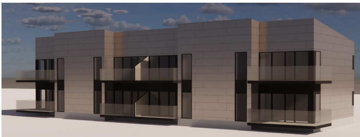
Facade mod nord

Blokken indeholder 8 ens 2-rums boliger – 4 i stueplanet, og 4. på 1. salen.