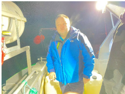
Upernaviup eqqaa Iserartunermut Unnuttalersuullungu angalavunga