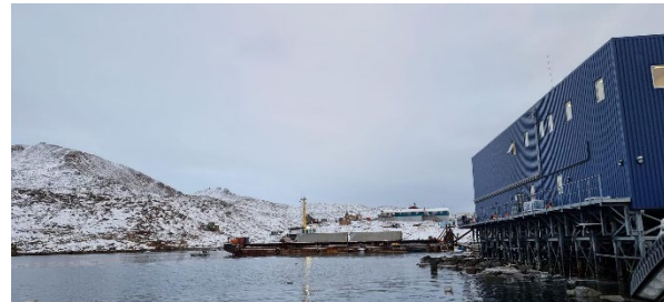
Nuussuarmi Inuutissarsionermi Ukiuni kingullerni Qitiusoq aalisakkerivik