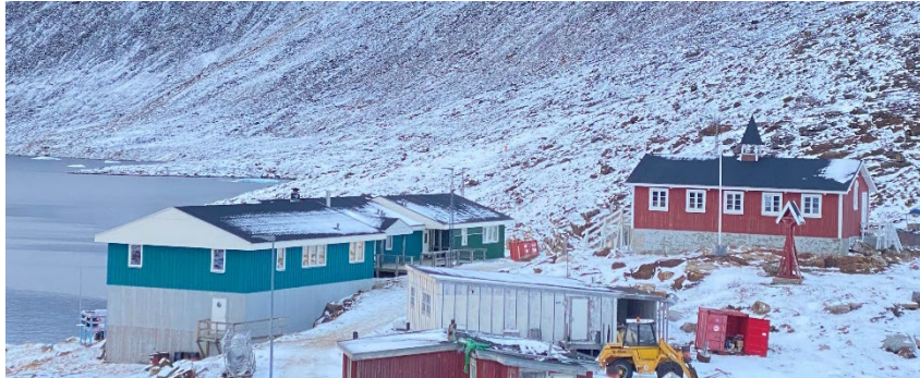
Nuussuarmi atuarfik pikkorissaavinga